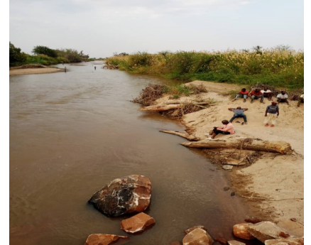
Mto Ruaha Mdogo