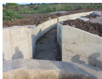
Sehemu ya Miundombinu katika mradi wa Nanganga

Mradi wa Nanganga ni kati ya Miradi kumi na sita (16) ya SSIDP III (Small Scale Irrigation Development Project) ambapo kwa Mkoa wa Lindi imetekelezeka miradi mitatu ambayo ni wa Skimu ya Umwagiliaji Kinyope, Nanganga na Ngongowele Wilayani Newala.