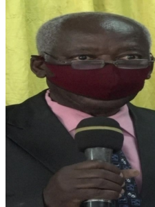
Mwenyekiti wa Bodi, Tume ya Taifa ya Umwagiliaji.

Seneda ameongeza kuwa endapo Menejimenti ya Tume itazifanyia kazi ipasavyo changamoto zinazopunguza kasi ya uwekezaji wa sekta binafsi katika kilimo cha umwagiliaji sekta hiyo itachangia ukuwajibu wa uchumi wa sekta ya Umwagiliaji kwa kasi Zaidi.