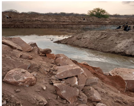
Ujenzi wa Tuta Mto Ruaha Mdogo wakamilika