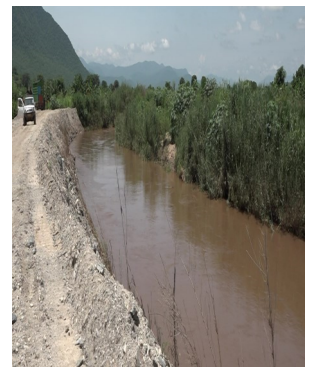
Mto Lukosi warejea katika hali yake ya kawaida

Kwaupande wao baadhi ya wakaazi wa kijiji cha Ruaha Mbuyuni wamesema maisha katika kata hiyo yamerejea katika hali ya kawaida, wakaazi wa maeneo hayo wanakwenda shambani kulima, wanafunzi wanakwenda shuleni kama kawaida, na wafanya biashara wanaendelea na shughuli zao kama kawaida.