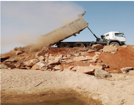
Lori la Tume likimwaga mawe na vifusi Wakati wa ukarabati mto Ruaha Mdogo.