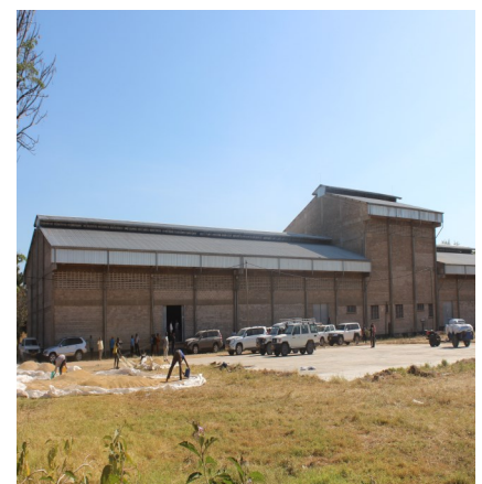
Ghala la Madibira